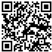
【1】ご登録フォームにアクセス

【ご登録フォーム】 https://tkp-jp.zoom.us/webinar/register/WN_YYHMzJKrSiyOx180E-xYHQ