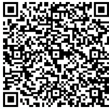
【1】ご登録フォーム にアクセス